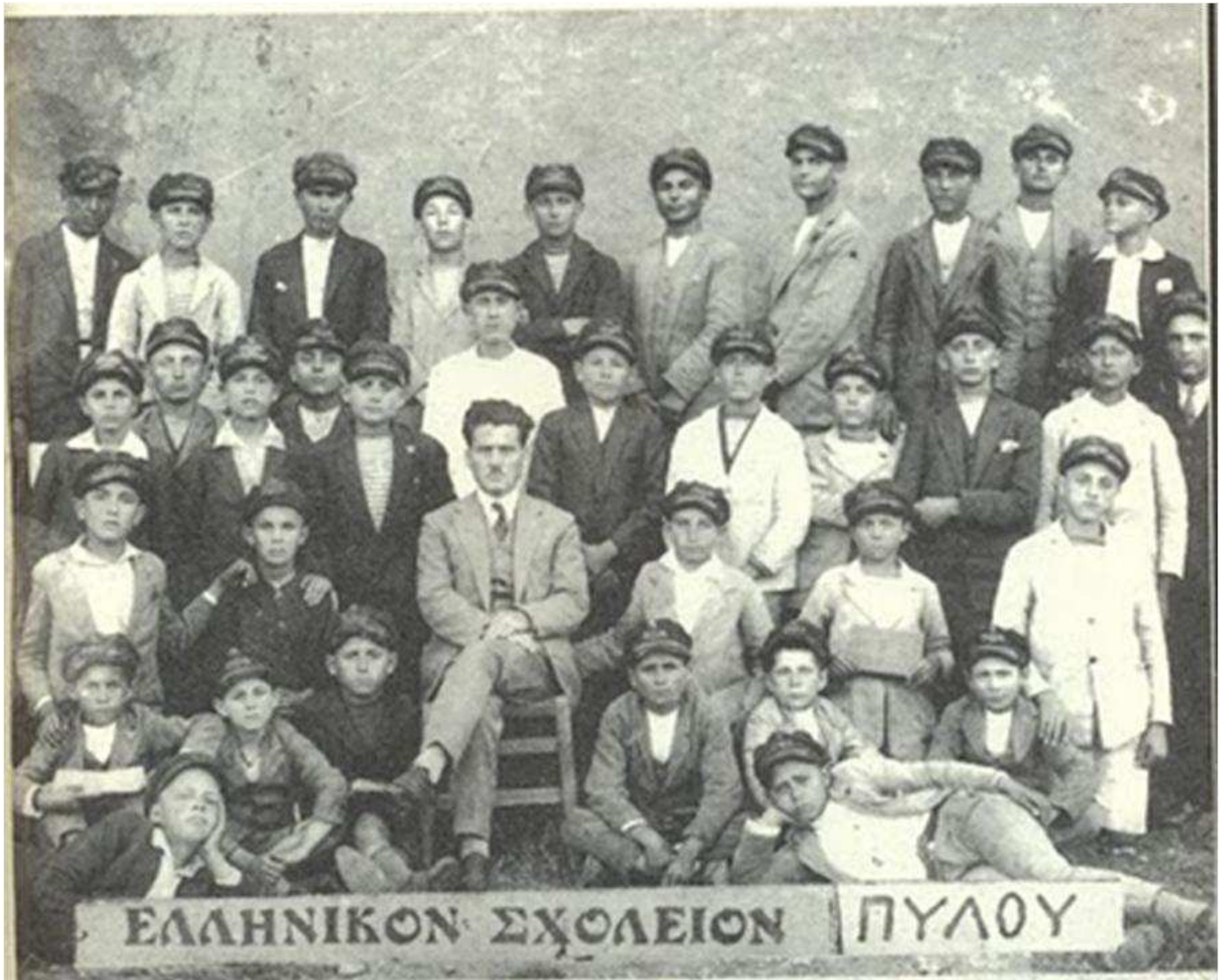
Ελληνικό Σχολείο Αρρένων Πύλου (1930) με τα διακριτικά καπέλα των μαθητών που καμάρωναν γύρω από το δάσκαλό τους.